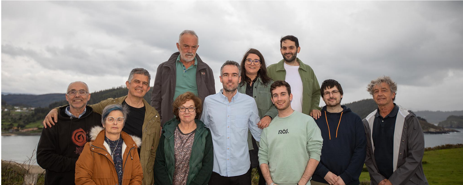
O equipo do BNG de Ortigueira